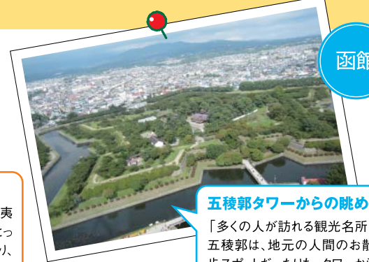
五稜郭タワーからの眺め 「多くの人が訪れる観光名所・五稜郭は、地元の人間の散歩スポットだったりも。タワーから見る星形の城郭は、何度見ても感動を覚えます」