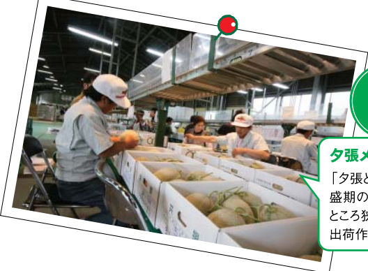
夕張メロンの検査の様子 「夕張といえば、夕張メロン。最盛期の検査場は、広い場内にとろ狭しと人がひしめき合い、出荷作業に追われます」