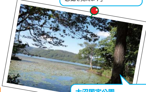
大沼国立公園 「夏の晴れた日の大沼は、湖面が輝いてとてもきれいです。ボートやカヌーで水面から見る景色は、岸から見るのとはまたひと味違います」