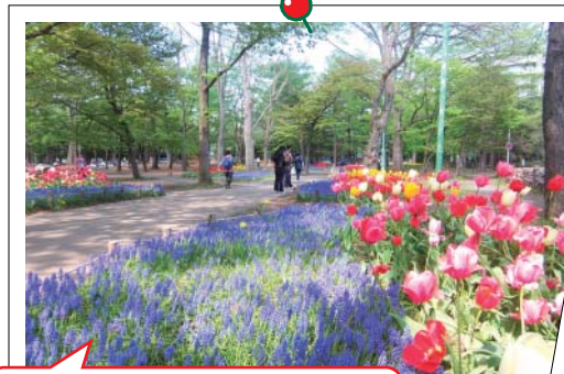
花咲く円山公園 「円山公園は初春の桜が有名ですが、ほかにもたくさんの花を楽しめ、散歩スポットとしても人気があります。写真は初夏の公園内です」