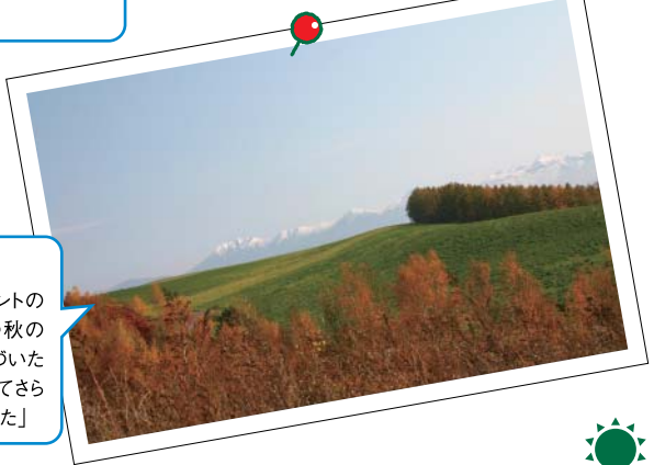
「美瑛のビューポイントのひとつ、新栄の丘の秋の眺め。夕暮れ時、色づいた木々が日に照らされてさらに赤さを増していました」