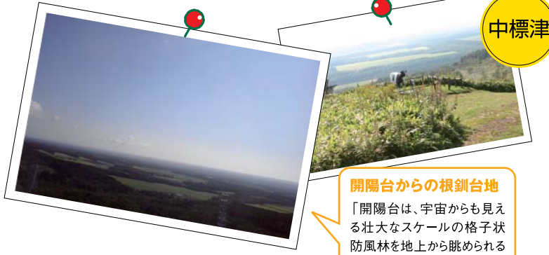
開陽台からの根釧台地 「開陽台は、宇宙からも見える壮大なスケールの格子状防風林を地上から眺められる貴重な場所。夏は開陽台までの途中に、中標津らしい牛の親子のモニュメントが登場」