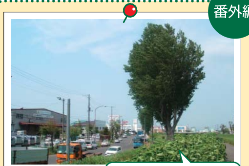
札幌本社屋前のポプラ 「昭和51年に流通センターに社屋を移転した当時には、すでに大きく成長していた厚別川沿いのポプラ。雨の日も風の日も雪の日も、会社を見守ってくれています」