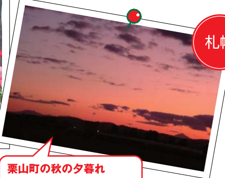
栗山町の秋の夕暮れ 「ちょうど稲刈りの真っ盛りの時期に撮りました。燃えるような赤から紫へのグラデーションが神秘的。この後、まもなく日は落ちました」