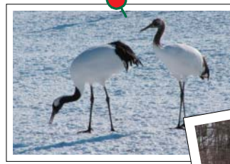
雪原のタンチョウ 「国の天然記念物、タンチョウ。かなり大きく、翼を広げると2メートル半ほどもあります。タンチョウの舞は優美ながら迫力があります」