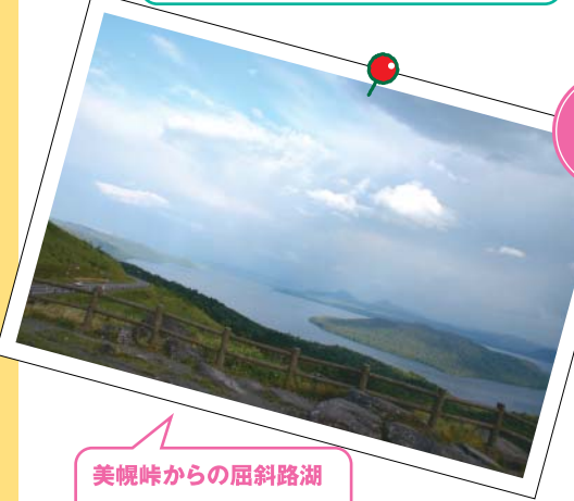
美幌峠からの屈斜路湖 「屈斜路湖は日本最大のカルデラ湖。「砂湯」も有名です。美幌峠からの一枚です」