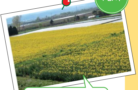
菜の花畑 「滝川は4年連続で菜の花の作付面積全国一！花の見頃は5月下旬から6月上旬。視界を染める黄色に、春の訪れを実感します」