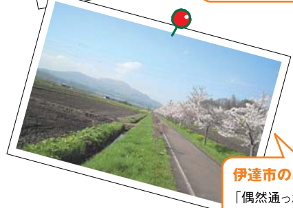
「偶然通った道で見つけた風景。何気ない場所でもこんなに美しい景色が見られる北海道は最高だなと思いました」