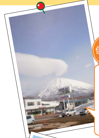
羊蹄山 「観光客を魅了する蝦夷富士は、地元の人にとっては、ふるさとの象徴であり、心のよりどころ。写真は北海道うまいもの農園倶知安店の新駐車場からの眺めです」