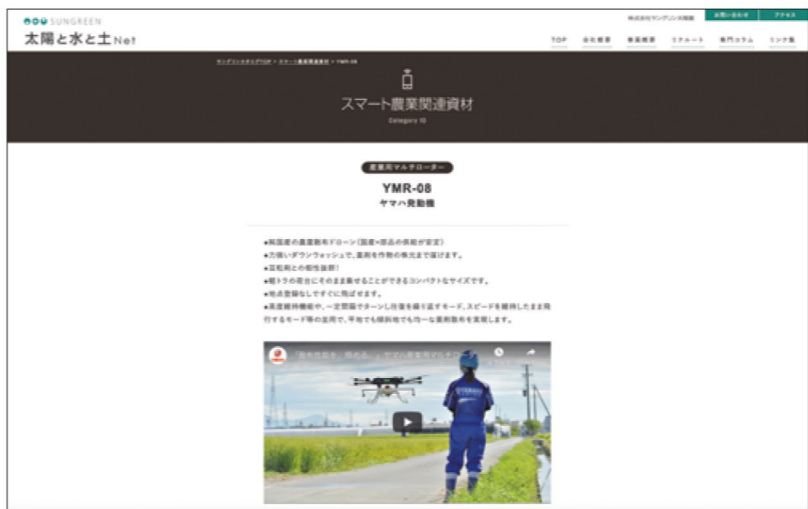
▲動画が掲載されているページ(イメージ)